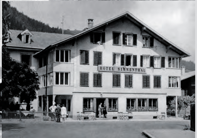
50a | 50b 51a | 51b

50 a, b Hotel Reber in Locarno. Links: vor dem Umbau von 1928. Rechts: nach dem Umbau. Die Sanierung im Sinn der damaligen Moderne beinhaltete die Eliminierung des Mansarddachs und die Aufstockung des Gebäudes um ein Geschoss.