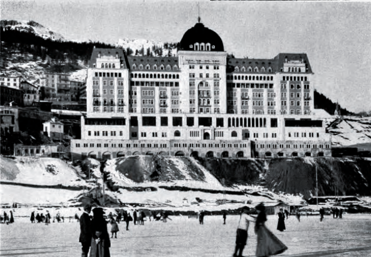
48a | 48b 49 |

47 (Seite 80) Abbruch des Grand Hotels Schreiber auf Rigi Kulm, 1952. Die Entfernung von Hotelbauten aus der Belle Époque war Teil der Aktion von Schweizer Heimatschutz und Schweizerischem Bund für Naturschutz zur Umgestaltung der Bergspitze.