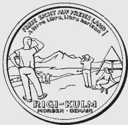
52a 53 52b 54

52 a, b Sujet des «Rigi-Talers» von 1951. Die von Schweizer Heimatschutz und Schweizerischem Bund für Naturschutz verkauften Schokoladetaler thematisierten auf der Vorderseite den vorherrschenden und auf der Rückseite den zukünftigen Zustand der Bergspitze.